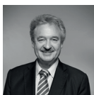
Jean Asselborn, Ministre des Affaires Etrangères de 2004 à 2023