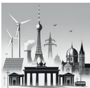
Table ronde «L'énergie, secteur-clé de l'économie en Europe»

Robert Habeck, Ministre allemand de l'Economie jusqu'à mai 25